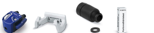
PURITY C kit de cabezales filtrantes III 0 - 70 %