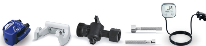
PURITY C kit de cabezales filtrantes VII 0 - 70 %