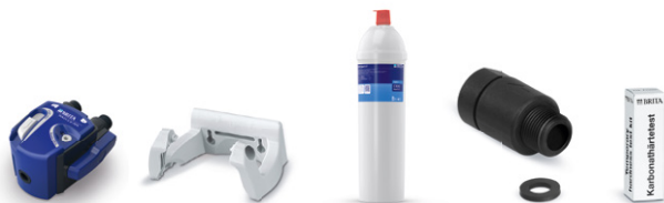
PURITY C300 Quell ST kit de instalación inicial 6