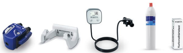
PURITY C150 Quell ST kit de instalación inicial 4