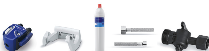
PURITY C150 Quell ST kit de instalación inicial 2