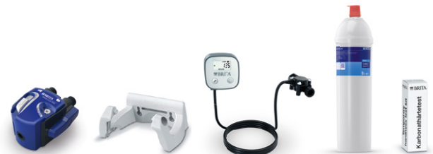
PURITY C500 Quell ST kit de instalación inicial 10