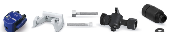
PURITY C kit de cabezales filtrantes VI 0 %