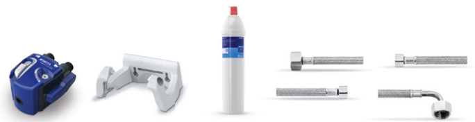
PURITY C150 Quell ST kit de instalación inicial 8