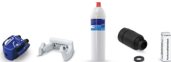
PURITY C500 Quell ST kit de instalación inicial 11