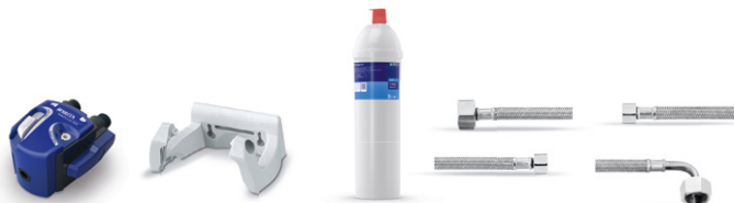
PURITY C300 Quell ST kit de instalación inicial 9