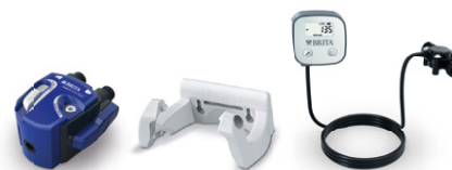
PURITY C kit de cabezales filtrantes VIII 0 - 70 %