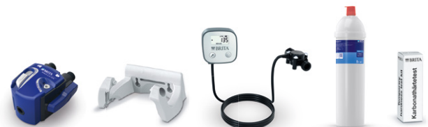
PURITY C300 Quell ST kit de instalación inicial 7