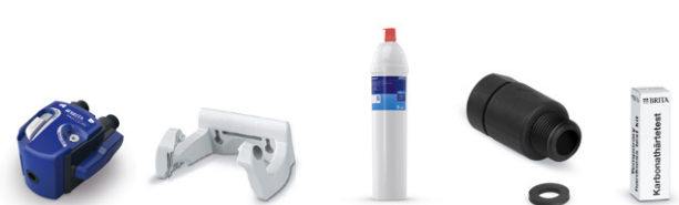
PURITY C150 Quell ST kit de instalación inicial 5