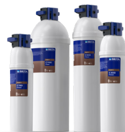
PURITY C Finest